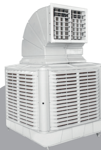
CLIMATIZADOR REFRIFORTE - P

CLIMATIZADOR PORTÁTIL COM SAÍDA SUPERIOR DE AR