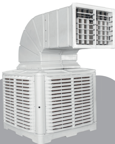
CLIMATIZADOR REFRIFORTE - S