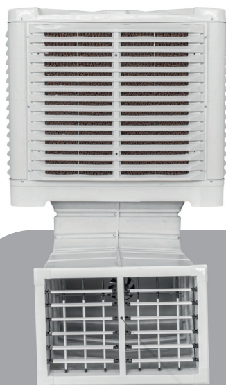
CLIMATIZADOR REFRIFORTE - I