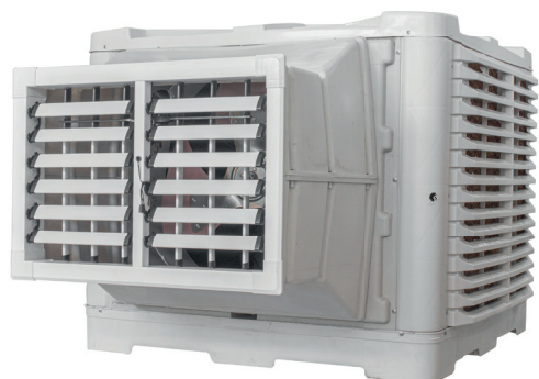
CLIMATIZADOR COM SAÍDA FRONTAL DE AR